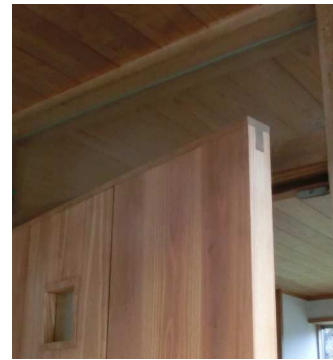
スッキリとしたデザインを可能としたT框