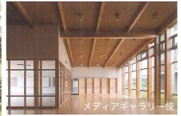
メディアギャラリー棟