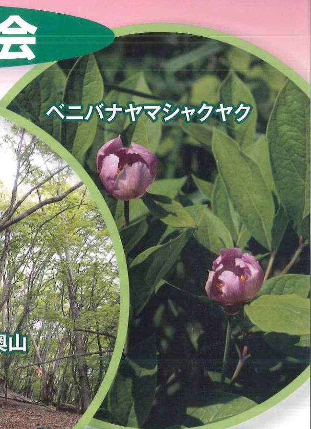
ベニバナヤマシャクヤク