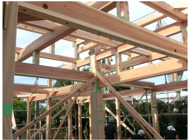
工事中:産直材(桧・杉)を大黒柱・小屋組に使用