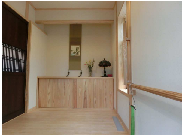
事例 : 玄関ホール(手摺・骨董木製建具)