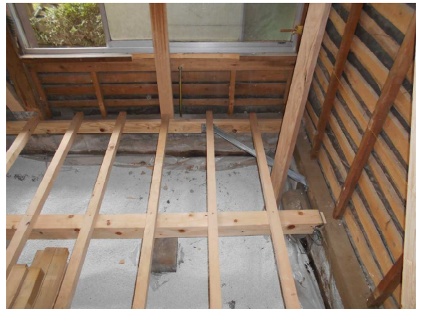
耐震リフォーム：床下の湿気対策工事