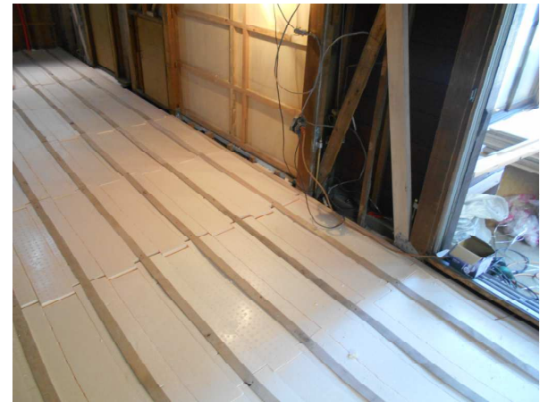
耐震リフォーム：床板下の断熱工事