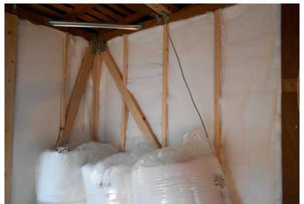
耐震リフォーム：外壁の耐震補強・断熱工事