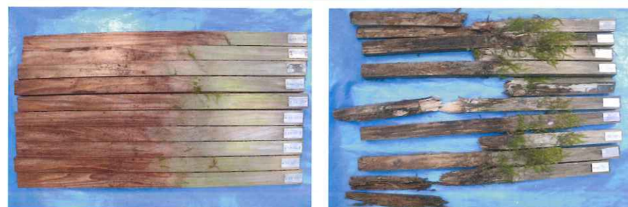
野外防腐試験写真(3年目)