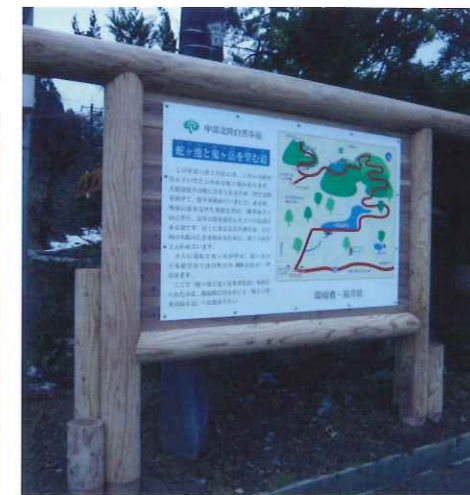
▲白山国立公園案内板