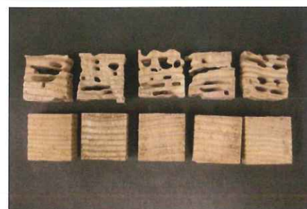
室内防蟻試験結果

ミラクルローレルAZは、JIS規格(JIS K 1571)に規定された室内防腐試験・室内防蟻試験・野外防腐試験・野外防蟻試験にて性能を評価し、性能基準を満たす結果が得られています。