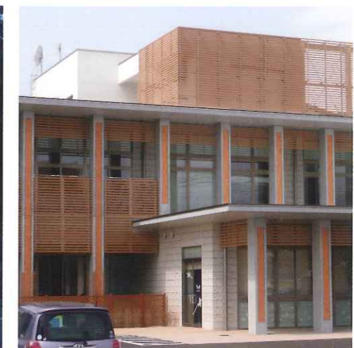
▲建築外壁・ルーバー