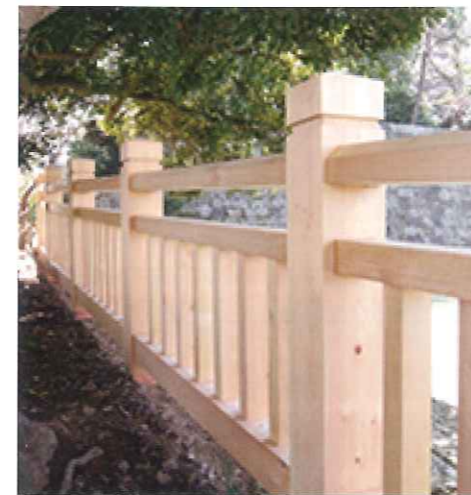
▲福井城址土橋欄干

金属(銅)を含有していないため、緑色の着色がなく、無色の自然な仕上り。カラーリングも自由自在。