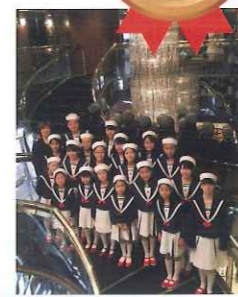
赤い靴ジュニアコーラス

三塔を祝う ～次の100年につなぐ未来への架け橋～ 赤い靴ジュニアコーラス、港中学校・仲尾台中学校の 吹奏楽部・横浜市消防音楽隊による4部構成の記念 コンサート。