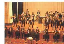
横浜市立港中学校 吹奏楽部