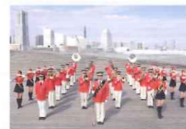
横浜市消防音楽隊