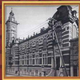
大正6年竣工時の会館