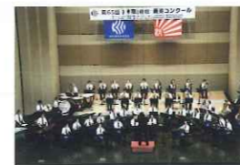
横浜市立仲尾台中学校 吹奏楽部