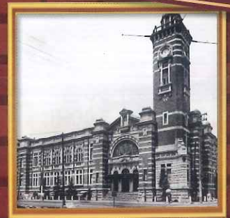
昭和2年再建時の会館

【主催】 中区制90周年・開港記念会館100周年記念事業実行委員会 【協力】 横浜税関・神奈川県・中区社会福祉協議会・岩手県金石市・熊本県・熊本市・埼玉県飯能市・群馬県嬬恋村・ジャックサポーターズ・日本大通り活性化委員会・横浜三塔協議会・株式会社新日屋・神奈川県家具工業組合かなもく塾・ダニエル株式会社・I.TOON 【関連事業】 第33回全国都市緑化よこはまフェア 【問合せ先】 中区役所地域振興課 TEL:045-224-8135 (当日は開港記念会館 TEL:045-201-0708) ※イベントの内容は変更になる事があります。